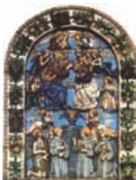
La terracotta invetriata di Andrea della Robbia The glazed terracotta by Andrea della Robbia