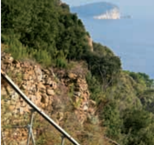
Tratto di costa occidentale e sullo sfondo le isole del Tino e del Tinetto Stretch of west coast with Tino and Tinetto islands in background

One of the many possibilities offered by the pathways on the hills around the Gulf is to cross over in the direction of the sea at Cinque Terre (a part of the national Cinque Terre nature reserve is included in the La Spezia council district in the area around Tramonti) then follow the track descending from the ancient village of Biassa to Fossola with its tiny church dedicated to the Guardian Angel. From here, above an apparently boundless ocean, keeping above Monesteroli then Schiara, you can reach Campiglia with its church dedicated to St. Catherine.