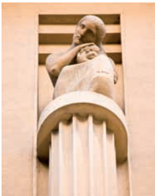
Scultura di Augusto Magli a decoro del Palazzo del Ghiaccio Sculptures by Augusto Magli adorning the Ice Building

galupi nel periodo compreso fra il 1906 ed il 1914, al seguito della ampia lottizzazione dei poderi dei marchesi Oldoini che qui erano collocati, e la Pensione Orioli, sobrio edificio nato come struttura alberghiera ed oggi abitazione privata, progettato dal futurista Manlio Costa nel 1935-'36, qui pacato assertore di un'edilizia residenziale di gusto eclettico.