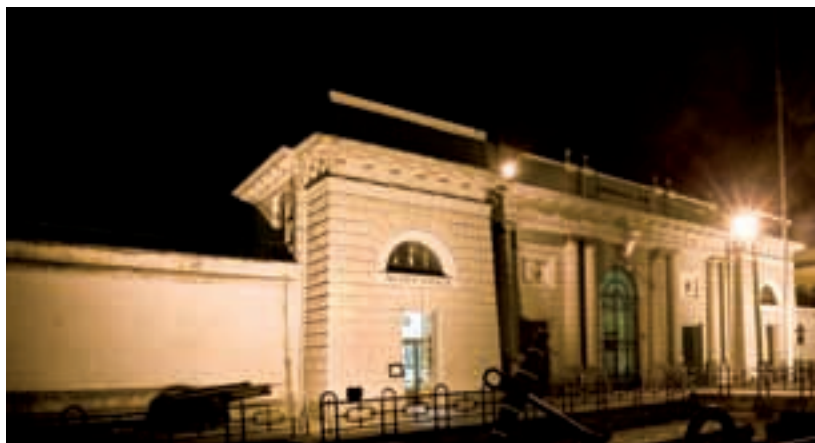
La porta monumentale dell'Arsenale Militare — Monumental gate to the Naval Arsenal