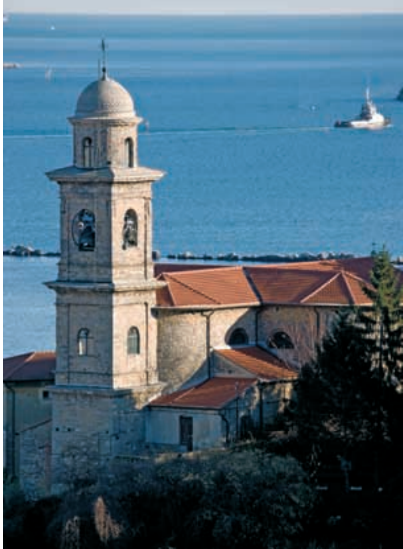
Campanile e parte absidale della chiesa di San Vito — Bell tower and apse in Saint Vito's church