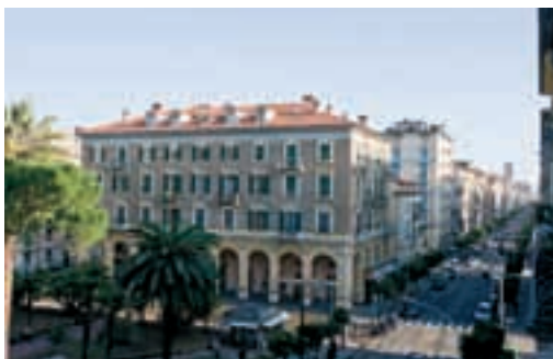
Piazza Brin e corso Cavour – Piazza Brin and corso Cavour

The church of Our Lady of Scorza, with a remarkable 17th century painting inside portraying The Education of the Virgin by Giovanni Andrea De Ferrari – the heart of the entire square, inherited the name of a lost religious