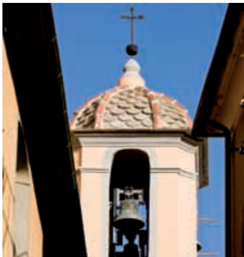
Il breve campanile della chiesa dei Santi Giovanni e Agostino Short bell tower of Saints John and Augustine church