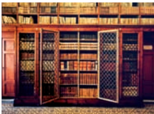
Salone principale, già sala da ballo della Palazzina — Main room, once the mansion's ballroom

La palazzina fu ceduta dalla famiglia Crozza alla Cassa di Risparmio della Spezia, dalla quale pervenne nel 1906 al Comune della Spezia quale sede della Civica Biblioteca, funzione che ancor oggi prestigiosamente mantiene.