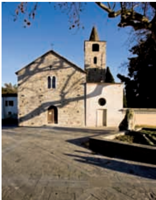
Pieve di San Venerio — Saint Venerius' church

Internamente al chiesa è a un'unica navata ma biabsidata con absidi aperte da monofore doppiamente strombate. Il campanile, il cui apparato murario è a piccoli conci tendenti al rettangolare, laddove invece non siano presenti vistose ritessiture, è posto sulla destra della chiesa, ed appare eretto indipendente dalla pieve romanica e solo successivamente inglobato nella costruzione sacra. Il registro inferiore, ben massiccio, non presenta alcun tipo di decorazione né aperture di ampia luce, mentre a partire da un'altezza corrispondente grosso modo all'attacco del tetto della chiesa si profilano delle larghe lesene angolari, spezzate da una sequenza di archetti pensili in cotto e in calcare. Le aperture a questi superiori così come l'apertura piramidale in lavagna sono certamente ascrivibili a più ampi interventi eseguiti nella chiesa nella prima metà del XVII secolo.