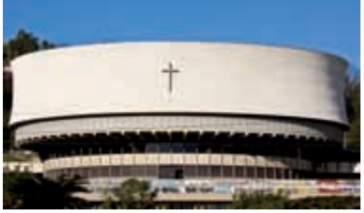
La cattedrale intitolata a Cristo Re – Christ King Cathedral

Libera's original project was in part revised by Cesare Galeazzi while the cathedral was being built and which was only consecrated in 1975 after lengthy works.