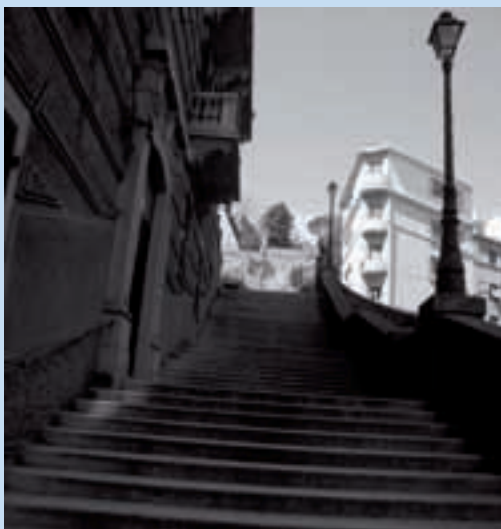
Scalinata San Giorgio. Al culmine la futurista Casa Peragallo di Manlio Costa Saint George steps with Manlio Costa's futurist Casa Peragallo at the top

Moreover in some cases the name of these flights of steps is evidence of historical situations or how the district was exploited: for example the place-name Fondegga , shows that there was once a fondeco , that is to say a store house for the ancient port in this area, probably in the direction of what is now piazza Verdi; the same for the name of the Bastia steps, recalling the bastion built in the second half of the XVI century to support St. George castle on the site where the university campus now stands; again Vanicella stands for a small course of water, now flowing under via Chiodo, running down from the hills along the side of the castle to feed the small docks where the naval base of the Dukes of Milan once stood in the XV century.