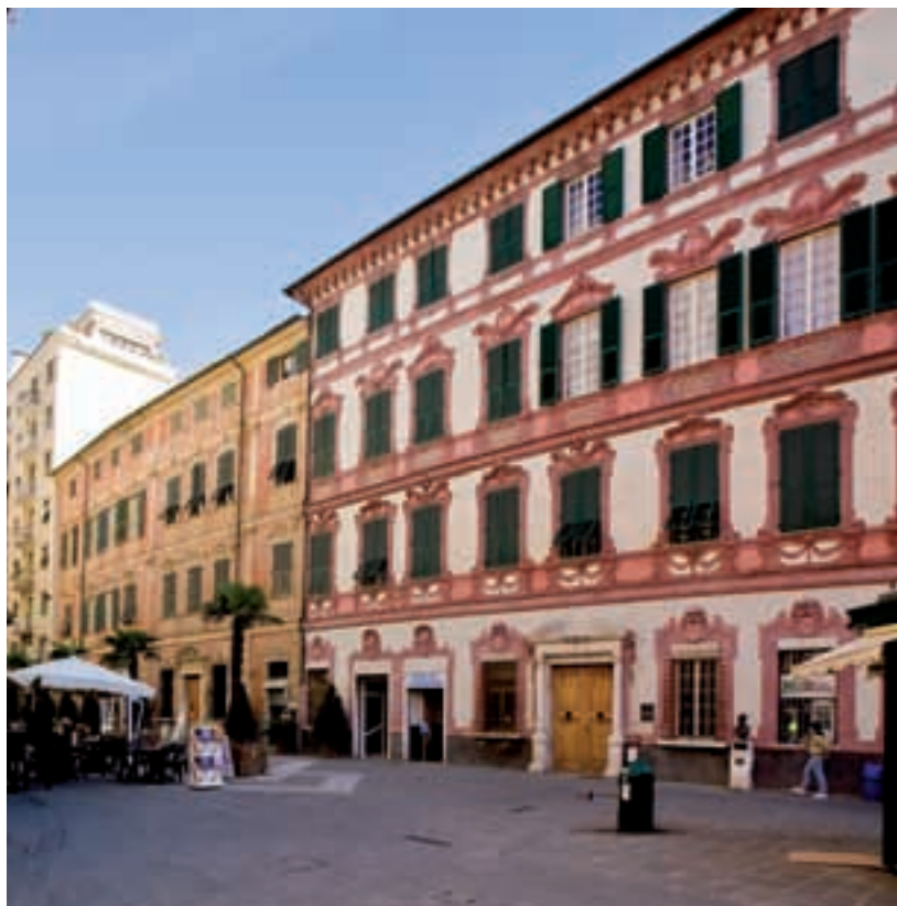
Piazza Sant'Agostino. In primo piano il Palazzo Oldoini ora De Nobili – Piazza Sant'Agostino. Palazzo Oldoini now De Nobili in foreground

portals of the palaces once belonging to the Doria family and the Princes of Massa. Ligurian towns are made up exactly of carrugi , narrow streets where houses are generally adjoining, houses with towers incorporated for defensive purposes and small openings, where there was more room to carry out business and social life, not large squares but more like courts. So here you have what was the small Augustinian court, now piazza Sant'Agostino, where once upon a time there was a convent founded in 1390 in the upper part: here the baroque manors standing in a continuous row as far as the sea incorporate the old tower houses, clearly seen by the traces of marble and sandstone along the bottom part of the buildings. But St. George castle is certainly the most