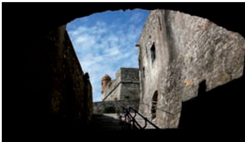
Il collegamento interno del Castello – Pathways inside the castle