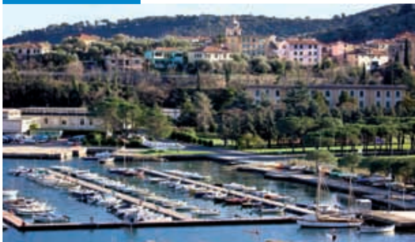
La base dell'aeronautica Militare a Cadimare con l'aereo Fiat59 — Cadimare Air Force base with Fiat59 aeroplane