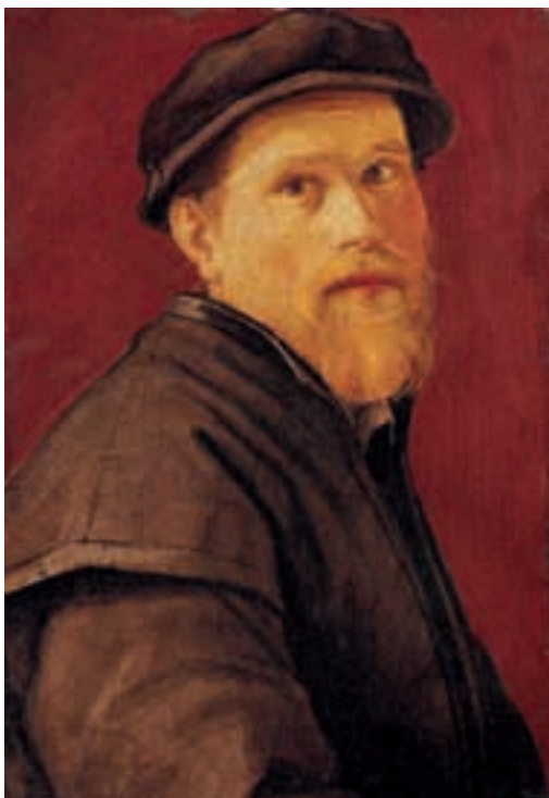
L'Autoritratto di Pontormo – Self-portrait by Pontormo

and Spanish booking ahead, detailed tours, teaching activities and assistance with thesis. Each room has data sheets to help visitors coming on their own to be as self-sufficient as possible. The bookshop inside sells items related to the museum, including catalogues of individual sections and historical-artistic literature pertaining to the collections on display. A multifunctional area houses exhibitions, meetings and workshops.