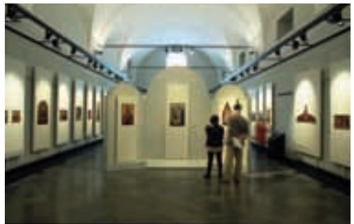
La sala dedicata alla pittura del XV secolo – Room with XV century paintings