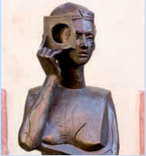
Francesco Vaccarone, Ritratto della Contessa di Castiglione , piazza Sant'Agostino

La divina contessa. Virginia Oldoini, contessa di Castiglione