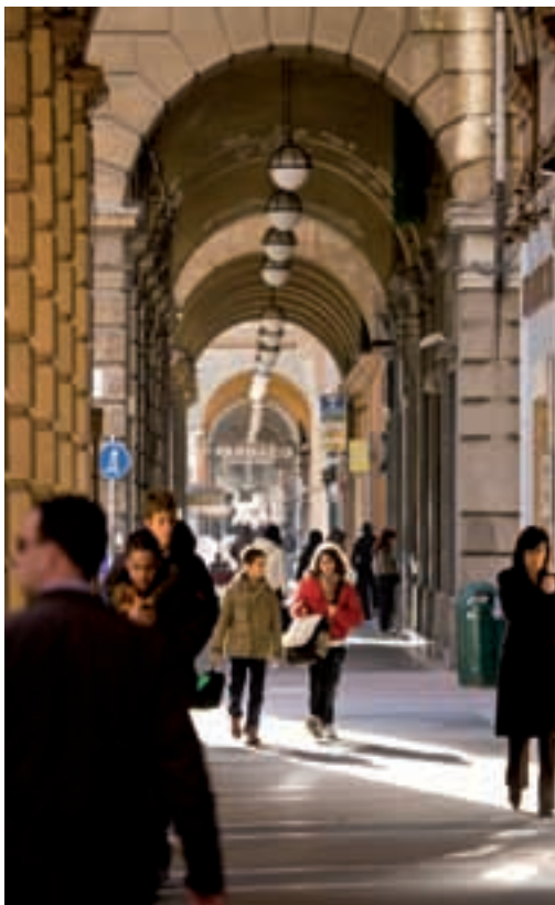
I portici di via Chiodo – The arcades in via Chiodo

togonali. La porticata via Chiodo corre fra piazza Verdi e piazza Chiodo, avendo ad occidente come prospetto scenografico la porta principale dell’Arsenale: è strada elegante, con edifici di gusto tardo neoclassico, in parte risarciti al seguito delle ferite della seconda guerra mondiale, ed un tempo in gran parte destinati ad albergo. Di particolare interesse la leggera mole dell’ex Hotel Croce di Malta, nato negli anni Quaranta dell’Ottocento per volontà del marchese da Passano, ed oggi, dopo lungo e attento recupero, prestigiosa sede della Fondazione Cassa di Risparmio della Spezia. Già posto direttamente sul mare, laddove oggi invece corre la via Giovanni Minzoni, era dotato di due palazzine gemelle sui fianchi, adibite a stabilimenti balneari secondo una tipologia edilizia consueta, perdute oggi in seguito alla mutata funzione dell’edificio che, dal 1921 fino al 1995, è stato sede del Banco di Napoli.