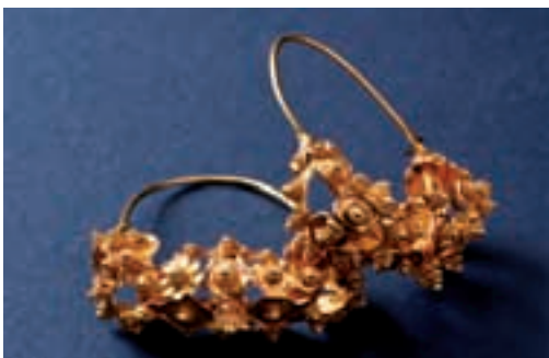
Orecchini in filigrana d'oro – Gold filigree earrings