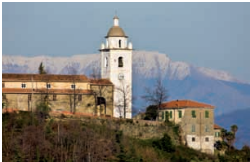
Pieve di Santo Stefano di Marinasco — Saint Steven's parish church at Marinasco