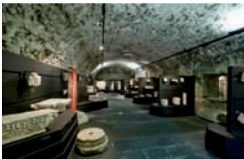
La sala dedicata ai reperti architettonici della Collezione Fabbriotti Room with architectural finds from the Fabbriotti Collection

Luni, the resplendent sister of the sun, the brilliantly white city, still compared to uncontaminated snow in the V century A.C. and which by this time was disintegrating into the green of the countryside, furnished an exciting store of finds illustrating with great precision both the public official life as well as the more daily routine aspects of the community that lived there. The architectural section, the room devoted to cults, in particular funeral rites, the instrumenta domestica (domestic utensils), the statues and portraits, the mosaics and collections of ancient inscriptions, up to the extraordinary Byzantine and Carolingian marble fragments coming from the lost Luni cathedral, guarantee a fascinating tour into Roman art and culture until they were incorporated by other cultures after the fall of the Empire. Lastly one can enjoy a view of the whole of the Gulf, its hills and the perpetual brilliance of the Apuane Alps from the castle terraces.