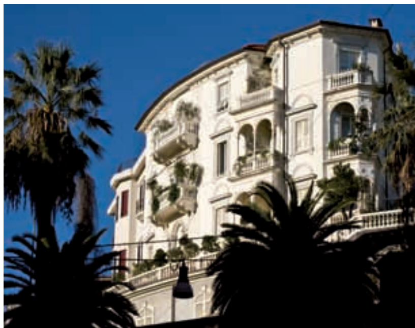
L'edilizia residenziale novecentesca di via XX Settembre – 20 th century houses in via XX Settembre

All'interno dei Giardini Pubblici, compreso fra le vie Diaz, Italia, Da Passano e Mazzini, con ingresso da quest'ultima, è il Centro Allende, spazio espositivo adibito a manifestazioni culturali.