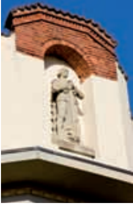
San Giorgio sull'attico dell'ex albergo omonimo Saint George at the top of former hotel with same name