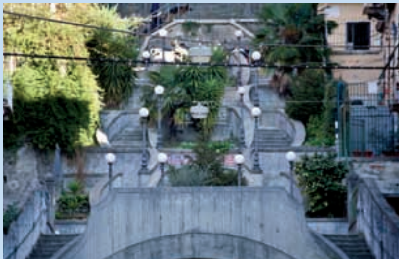
Scalinata Spallanzani — Spallanzani steps