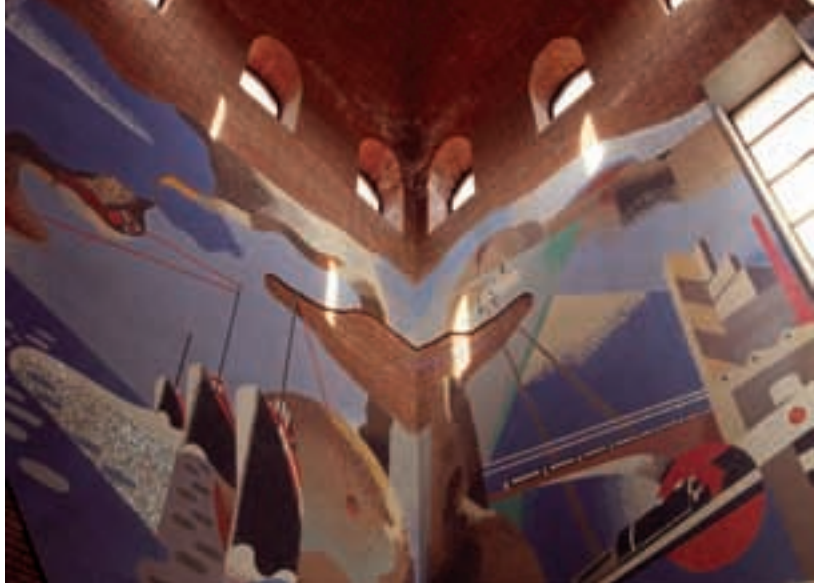
I mosaici di Fillia e Prampolini — Mosaics by Fillia and Prampolini

structure of the Central Post Office, designed in 1933 by Angiolo Mazzoni, has a whirl of mosaic work representing land, sea and air communications, a work by Fillia and Prampolini inside the tower at the top, created to celebrate the futuristic city, its dynamic spirit and technical victories. Then we have Palazzo degli Studi , finished in 1923, a work by the architect from Carrara Armando Titta and Palazzo Giachino at the beginning of via Veneto, built in 1912 and quite probably referable to Vincenzo Bacigalupi. With its compact volumes, its formal elegance is entrusted to the projected and painted decorations both on the facade and under the porticoes, mixing vaguely suggestive neo-medieval decorations with classical formulae. The Palazzo del Governo (government house), designed and built after the Province system had been set up in 1923 and a work of that prolific Franco Oliva, is a classic of the classicism typical of the 30's. Inaugurated in 1928, the building is abundantly decorated by statues and commemorative bas-reliefs by Augusto Magli, extraordinarily merging in with the architectural volumes creating an impressive overall effect. Palazzo Boletto, elegantly placed to close up the square towards the sea, was built in 1927 to a project by the architect Bacigalupi. The building was