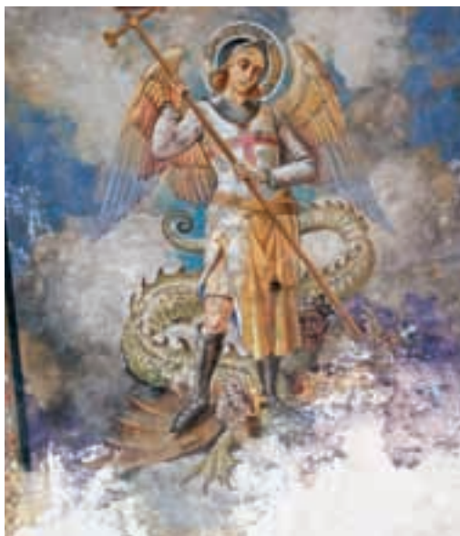
Affresco novecentesco raffigurante San Michele sulla volta interna 20 th century fresco portraying Saint Michael on vault inside

The greater part of the nearby village of Biassa, stands around church of St. Martin, in reality heir, also its name, to a more ancient foundation under road to Parodi on the eastern side of mount Verrugoli. The ruins of the original construction dedicated to St. Martin and especially the apse built in local pink stone, are all that remain of the church first recorded probably in 1229 and open to prayer up until the first half of the XVII century. An important religious foundation almost certainly linked with monastery of St. Venerius on Tino Island, representing a fascinating trace of the Gulf's thousand year history.