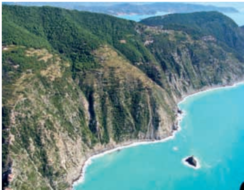
La costa di Tramonti – The coast at Tramonti

Si vuole che le tracce dei progenitori abitino ancora questo territorio, dai menhir di incerta datazione, e forse monumenti megalitici del V millennio a.C., ai posatoi, fino ai toponimi romani – l'Albana per tutti – e le vistose orme del Medioevo. A Campiglia, isolato e discosto dalla chiesa di Santa Caterina, il mulino del tutto simile a quelli posti sulla spiagnata del castello di Porto Venere vigila ancora, ormai inerte, questo paesaggio di intensa natura e denso di storia.