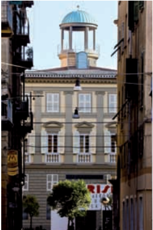
La sede della Fondazione Carispe, già albergo Croce di Malta Fondazione Carispe head office, formerly hotel Croce di Malta

There are many illustrated documents showing what this little tower used to look like, starting from the numerous paintings by Agostino Fossati illustrating the landscape which included the old watermill and others illustrating the monument itself in detail, both from the inside and the outside. In addition there are some prints and photographs such as the one kept in the La Spezia civic photographic archives, showing the hill known as Cappuccini or Ferrara hill, where the mansions belonging to the Countess of Castiglione and the great convent rising above the sea stand out against the sky and lower down among the houses of the suburb amongst which you can see the small