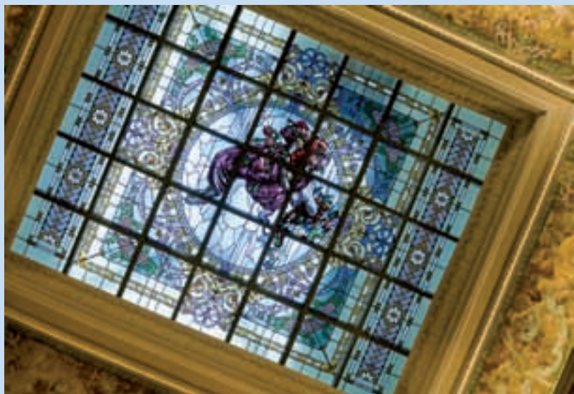
La vetrata di Beltrame nel vestibolo della villa — Beltrame's stained glass window in the hall of the villa