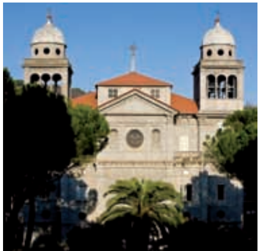
Facciata di Nostra Signora della Scorza – Facade of Our Lady of Scorza

Al centro dei giardini della piazza è posta la fontana di Mirko Basaldella, iniziata nel 1955, vale a dire nell'intenso momento artistico dello scultore udinese reduce dalla realizzazione della grandiosa cancellata del Mausoleo delle Fosse Ardeatine a Roma. È un periodo particolarmente denso dell'operato di Mirko, periodo che aveva avuto l'avvio allo scadere degli anni Quaranta, quando si collocano le sue prime esperienze di linguaggio postcubista: è il momento in cui realizza pitture e sculture polimateriche, dove il mito, a lui sempre caro, riemerge non come forma naturalistica, ma come "fantasma mitico favoloso". La decorazione del palazzo della FAO a Roma e la croce in ferro del Monumento ai Caduti per la libertà nel campo di sterminio a Mauthausen, insieme alla cancellata delle Fosse Ardeatine, come si diceva, sono gli immediati precedenti del monumento spezzino.