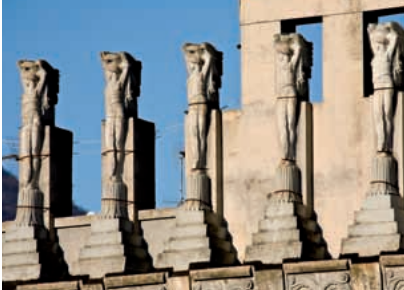
Teoria di sculture sommitali del cosiddetto grattacielo di via Veneto — Sculptures on top of the so-called via Veneto skyscraper

originally smaller than it is now, effectively coinciding with the western wing only and was extended in 1933 by adding an eastern wing, again designed by Vincenzo Bacigalupi. Uphill behind the square we have Palazzo San Giorgio, at number 9 via dei Colli, designed by Raffaele Bibbiani in 1927, an important example of civic architecture where the flowing well-proportioned volumes are magnified by the wealth of decorations on the building by Augusto Magli; again the Fondega buildings, built by Vincenzo Bacigalupi in the period running between 1906 and 1914, subsequent to parcelling out the estates belonging to the marquises Oldoini located here, and Pensione Orioli, a building with quiet tones built as a hotel and now a private house, designed by the futurist Manlio Costa in 1935-'36 and here a gentle advocate of an eclectic style of residential building.