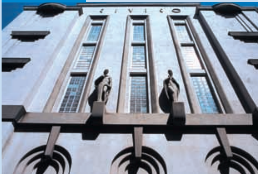
Facciata tergale del Teatro Civico – Civic Theatre's back facade