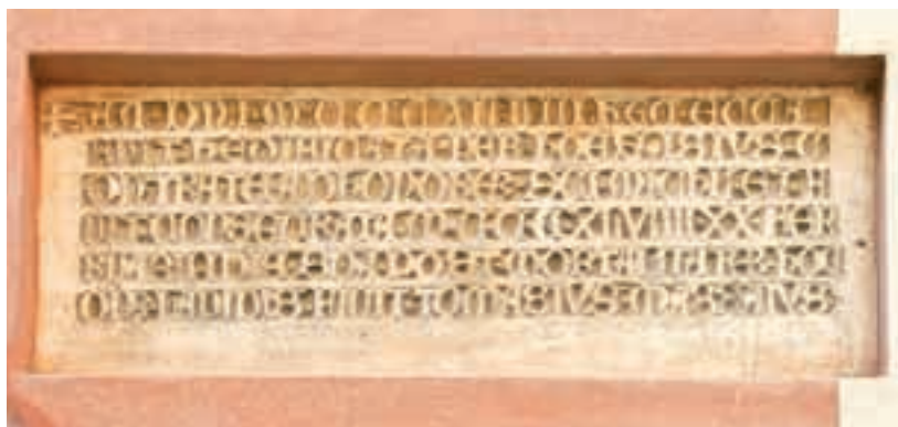
Epigrafe trecentesca posta sul campanile di San Michele — 14 th century inscription on Saint Michael's bell tower

In special modo risultano indicative per la precocità dell'insediamento le murature dei fianchi dove si evidenzia una tessitura ordinata ed a piccoli conci disposti regolarmente, con-