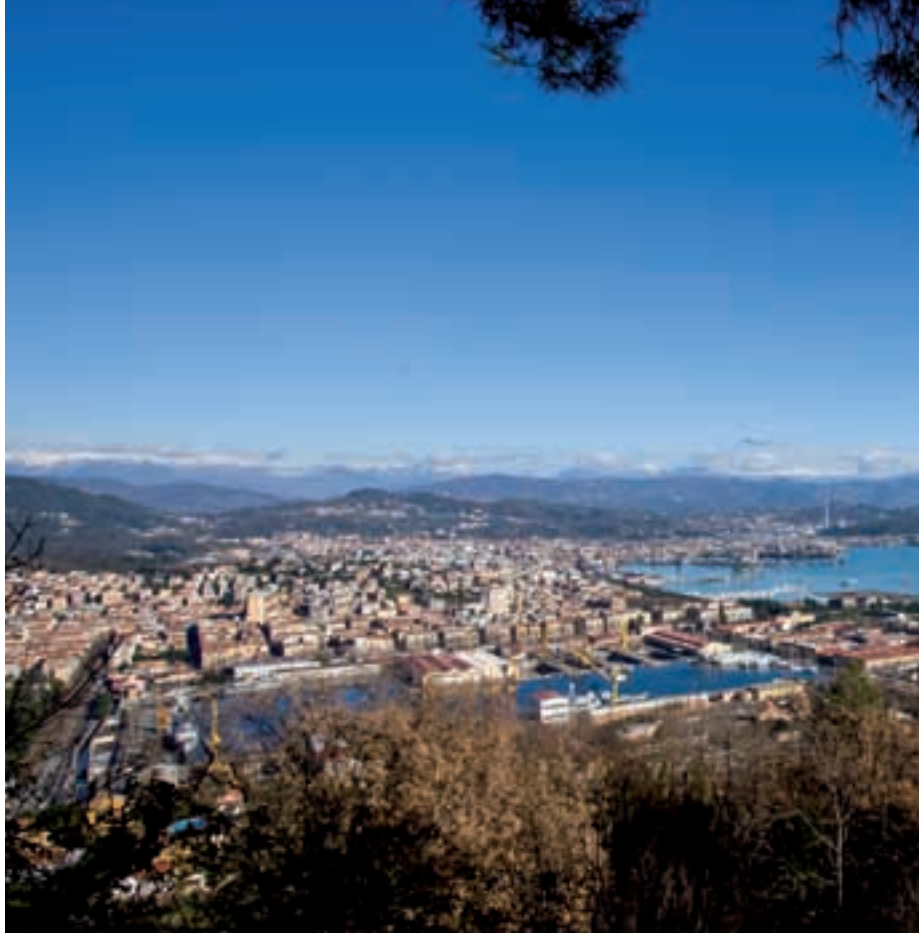
Panorama dalla Litoranea – View from the Litoranea coast road