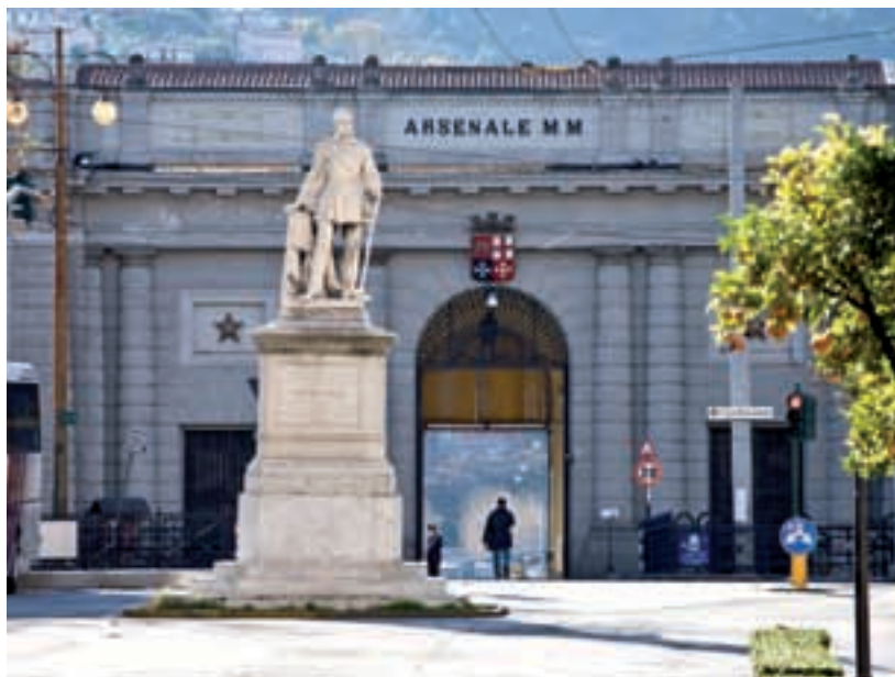
La porta principale dell'Arsenale. In primo piano il monumento a Domenico Chiodo di Santo Varni Main gate to the Naval Arsenal. Monument to Domenico Chiodo by Santo Varni in foreground

Proprio ai due protagonisti di questo intervento così decisivo per le vicende della Comunità spezzina sono dedicate le due arterie principali della città ottocentesca, fra loro or-