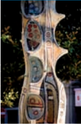
Particolare della fontana di Mirko Basaldella Detail of fountain by Mirko Basaldella

building sacrificed to the needs of the Arsenal construction site. A fountain by Mirko Basaldella stands at the centre of the square, begun in 1955, that is to say during an intense artistic period of the sculptor from Udine who had just finished the great gates to the Fosse Ardeatine mausoleum in Rome. It is a period particularly full of Mirko's works, starting in the 40's with his first post-cubist experiences: this is a time when he creates multi-material paintings and sculptures, where myth, always dear to him, re-emerges not with a naturalistic form but as a "fabled mythical spectre". The decorations on the FAO building in Rome and the iron cross on the statue to the fallen for liberty in the concentration camp at Mauthausen, together with the Fosse Ardeatine gates, mentioned above, come immediately before the La Spezia monument.