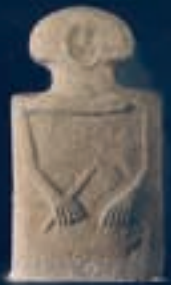
Statura stele Filetto I – Filetto I stela statue