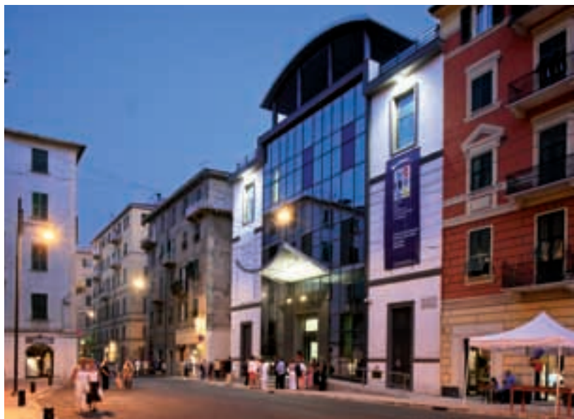
La facciata su piazza Cesare Battisti — Facade looking onto piazza Cesare Battisti