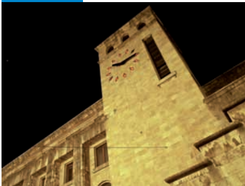
Palazzo delle Poste di Angiolo Mazzoni — General Post Office by Angiolo Mazzoni