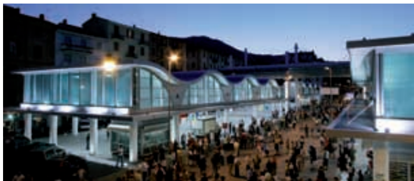
La rinnovata piazza del Mercato – Renovated Market place

Il centro commerciale Kennedy, realizzato non distante dal Palazzo di Giustizia dallo Studio Gregotti, appare operazione utile alla definizione di una parte di città fino a tempi recenti di incerta soluzione urbanistica: l'insieme degli esercizi commerciali, pur rivolti all'esterno, risultano convergere sull'ampia piazza quadrilatera definendo in questo modo uno spazio chiuso e dischiuso al contempo, privato ma pubblico, le cui dimensioni consentono non solo l'agile svolgimento dell'attività commerciale, ma anche la possibilità di manifestazioni sociali e di intrattenimento.