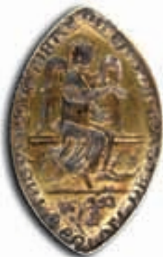
Matrice a navetta e sigillo — Oval matrix and seal